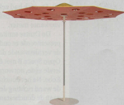
DE STIPPEN VAN PARASOL DOT VERSCHUIVEN ALS EEN MODERNE ZONNEWIJZER MEE MET DE ZON, Ø 300 CM, € 1.395 (SYWAWA).