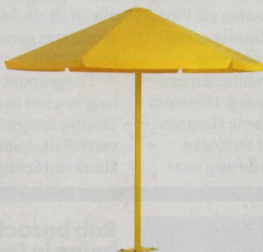
OP ZOEK NAAR PERMANENTE BESCHERMING? DE STALEN FOUR SEASONS VAN NOLA BIEDT HET HELE JAAR BESCHUTTING, Ø 239 CM, € 4.225.