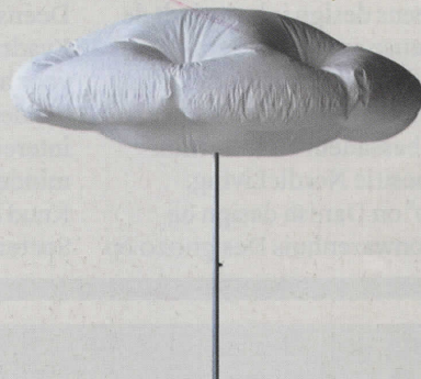
ALSOF ER EEN WOLKJE VOOR DE ZON SCHUIFT: DE CUMULUS PARASOL VAN STUDIO TOER BLAAST ZICH-ZELF OP ZODRA DE ZON BEGINT TE SCHIJNEN, € 465.