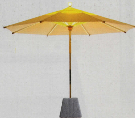
PARASOL EN TUINFAKKEL INEEN: DE NI VAN FOXCAT IS VOORZIEN VAN EEN LAMP DIE JE MET EEN HANDIG TOUCH-SYSTEEM KUNT DIMMEN, Ø 300 CM, € 3.930.