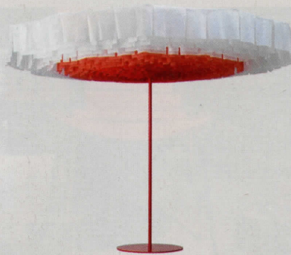
HET SCHERM VAN PARASOL BLOOM BESTAAT UIT LOSSE, STOFFEN BLOEMBLAADJES DIE VAN WIT NAAR VLAMMEND ROOD KLEUREN, Ø 300 CM, € 1.950.