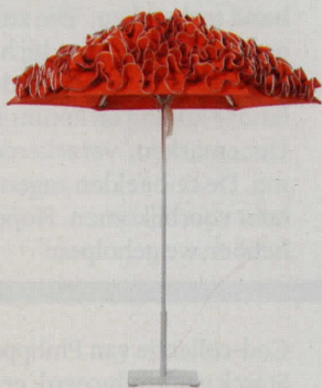
HOLA GUAPA! MET HET SCHERM DICTGEKLAPT DOET PARASOL FLAMENCO DENKEN AAN EEN SPAANSE ROK , Ø 194 CM, € 4.350 (SANTA BARBARA DESIGNS).