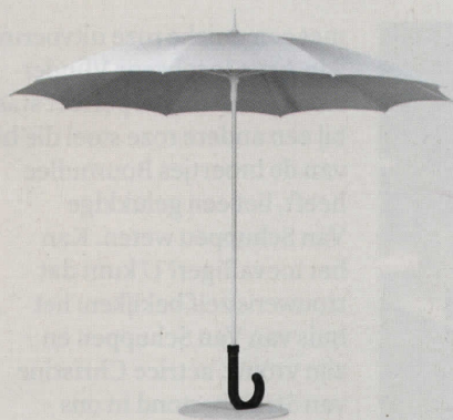
BESCHERMD TEGEN ZON ÉN REGEN: DEZE REUSACHTIGE PARAPLU VAN SYWAWA HEEFT DE TOEPASSELIJKE NAAM GULLIVER, Ø 295 CM, € 1.265.

Parasols Heerlijk, die lentezon, maar soms is ze al verrassend sterk. Met deze beauty's zit je er niet alleen beschermd, maar ook stralend bij.